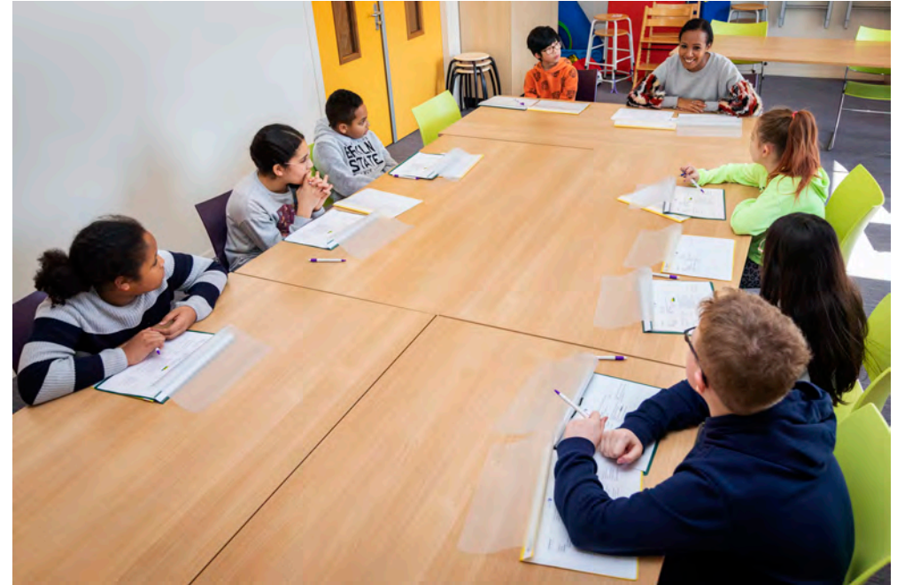
Leerlingraad groepen 6/7/8.